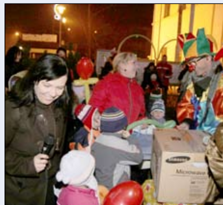
další fotografie jsou umístěny na: http://radvanicefoto.rajce.idnes.cz/